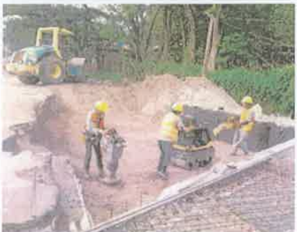
Foto 4. Compactación del material selecto colocado contiguo a pantalla de estribo.