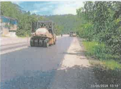
Foto 4. Taulabé – Desvió Santa Cruz de Yojoa Colocación y compactación de la franja de mezcla asfáltica.