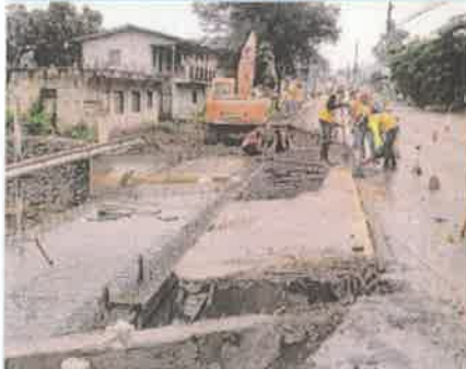
Foto 1. Demolición de acera peatonal y resto de pretil.