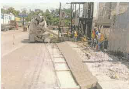
Foto 7. Vista de la acera construida.