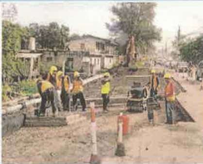
Foto 2. Vista de los trabajos realizados sobre el Puente.