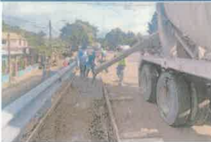
Foto 1. Fundición con concreto hidráulico de acera peatonal.