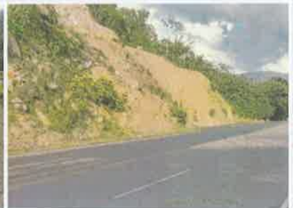
Foto 6. Taulabé – Desvío Santa Cruz de Yojoa Vista adelantal del tramo.