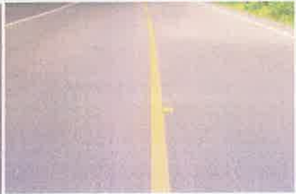
Foto 6. Colocación de vialetas doble cara sobre el pavimento.