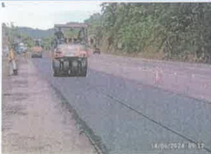
Foto 1. Taulabé – Desvió Santa Cruz de Yojoa Colocación y compactación de la franja de mezcla asfáltica colocada, espesor 5 cm.