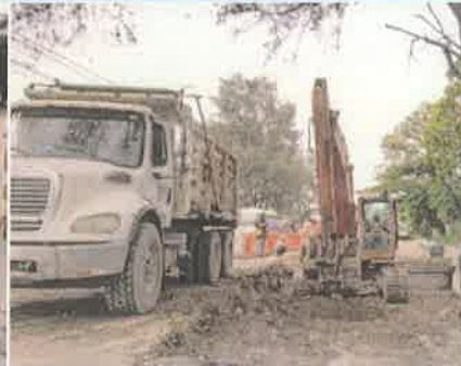
Foto 2. Retiro de material sobrante de excavaciones.