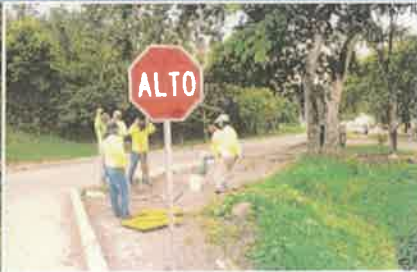
Foto 2. Instalación de la señalización vertical.