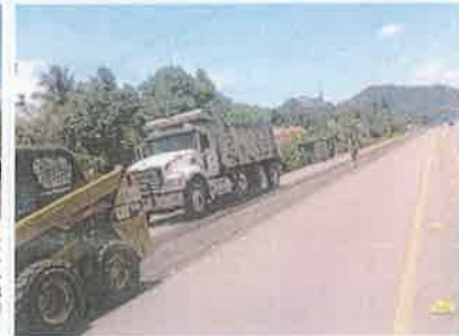
Foto 3. Taulabé – Desvió Santa Cruz de Yojoa Fresado capa superior de carpeta asfáltica dañada, espesor 5 cm