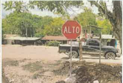
Foto 9. Colocación de señales en varios sitios del proyecto (señal preventiva)