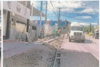
Foto 6. Fundición con concreto hidráulico de acera peatonal.