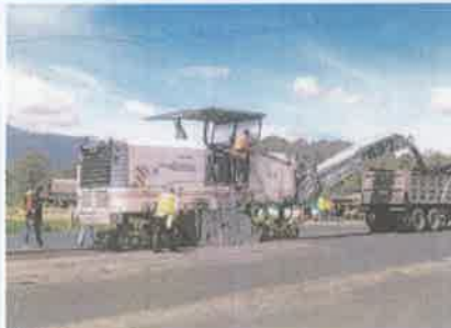
Foto 1. Siguatepeque - Taulabé Fresado capa de carpeta asfáltica dañada en sitio de falla.