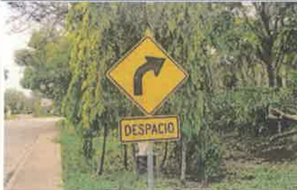
Foto 1. Instalación de señal preventiva.