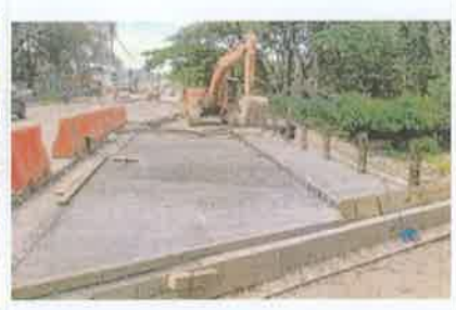
Foto 9. Vista frontal de la losa de rodadura y acera peatonal fundidas, lado derecho.