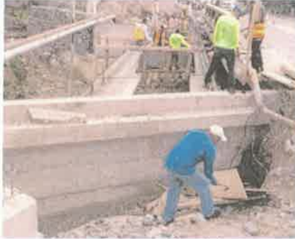
Foto 1. Preparando y encofrando área para construcción de losa de rodadura de Puente