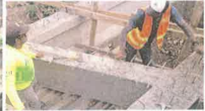
Foto 3. Diafragma construido entre vigas.