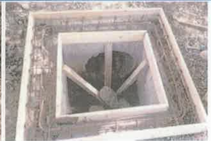
Foto 3. Vista de la colocación de acero de refuerzo, casquete de caja de registro.