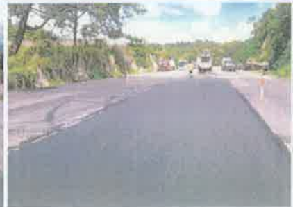
Foto 3. Siguatepeque - Taulabé Vista atrás, colocación de mezcla asfáltica en sitio de falla, actividad frecuente en el lugar.