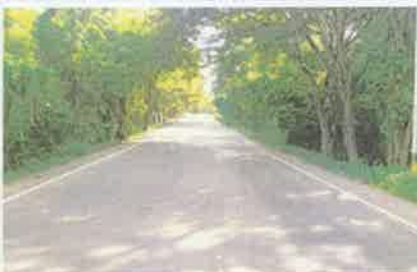
Foto 8. Vista de la pintura blanca en los laterales de la calle