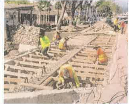
Foto 3. Vista del trabajo de encofrado realizado, lado derecho.