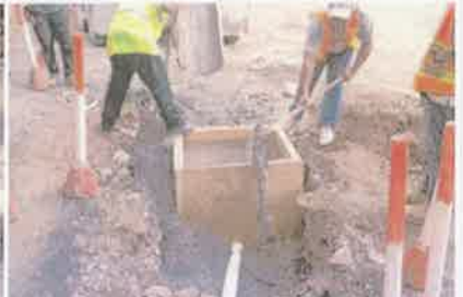
Foto 6. Construcción caja de registro