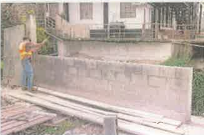
Foto 4. Vista lateral de la pared que colinda con una quebrada.