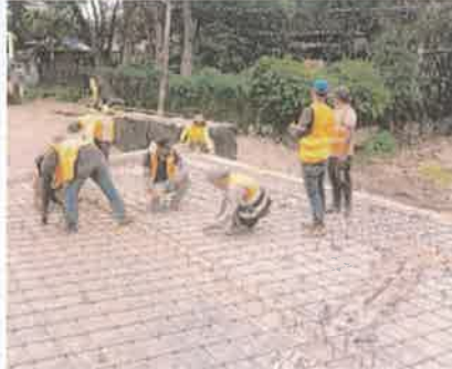
Foto 2. Vista de los trabajos realizados