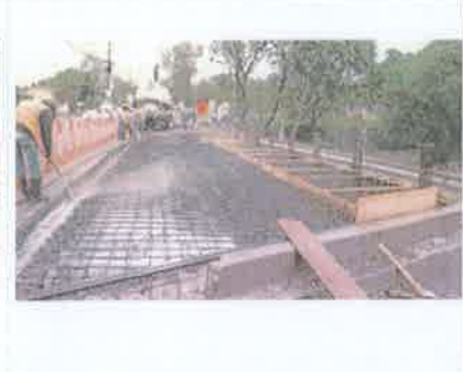
Foto 6. Vista del encofrado de acera peatonal y losa para realizar fundición.