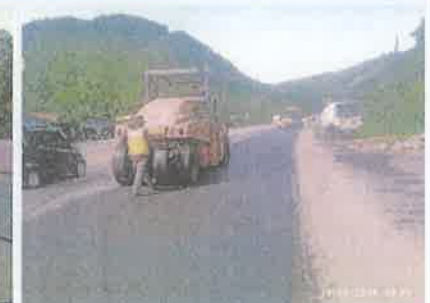
Foto 3. Taulabé – Desvió Santa Cruz de Yojoa Colocación y compactación de la franja de mezcla asfáltica, espesor 5 cm.