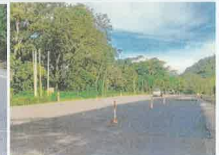
Foto 6. Taulabé – Desvió Santa Cruz de Yojoa Colocación y compactación de la franja de mezcla asfáltica, espesor 5 cm.