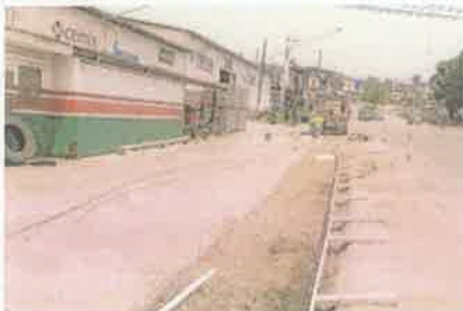
Foto 4. Preparación de área para construcción de acera peatonal frente a Ferretería.