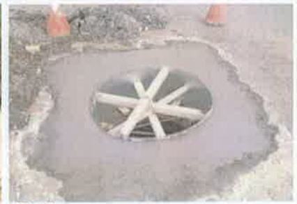
Foto 9. Fundición casquete de caja de registro.