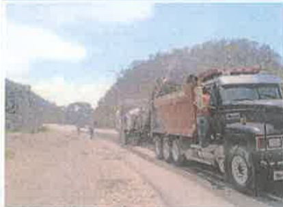
Foto 1. Taulabé – Desvió Santa Cruz de Yojoa Fresado capa superior de carpeta asfáltica dañada, espesor 5 cm