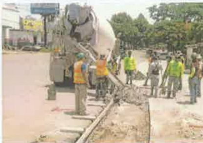
Foto 8. Fundición con concreto hidráulico, sección de acera peatonal, e: 10 cm