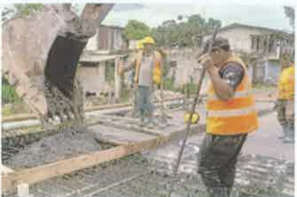
Foto 7. Fundición con concreto hidráulico de losa y acera peatonal.