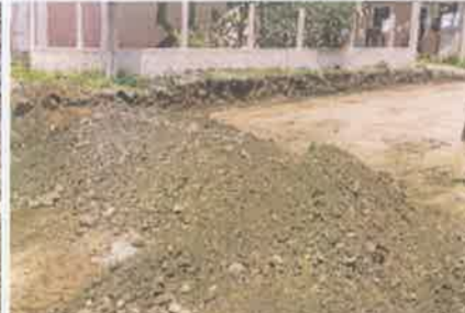
Foto 5. Trabajos de terracería realizados en acceso a calle.