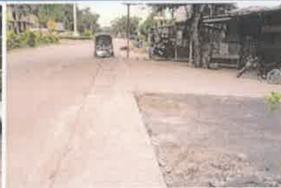
Foto 3. Vista de la acera peatonal construida.