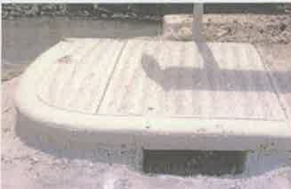
Foto 5. Vista del tramo de acera peatonal construido.