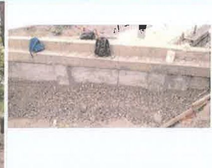
Foto 3. Material granular colocado contiguo a cortina de estribo. (filtro de agua)