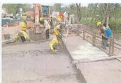
Foto 8. Vista de los trabajos ejecutados en la fundición de estructuras.