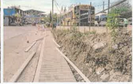
Foto 3. Vista de la acera peatonal construida.