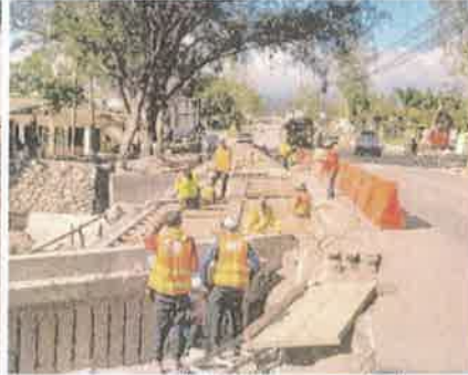
Foto 2. Vista del trabajo de encofrado realizado