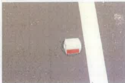
Foto 5. Colocación de vialetas doble cara sobre el pavimento.