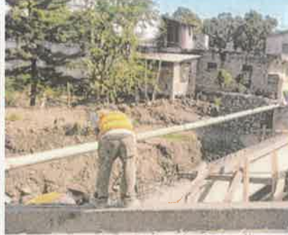
Foto 2. Reubicación de tubería metálica en el Puente.