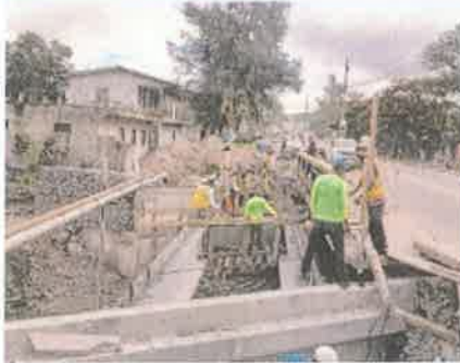
Foto 1. Construcción de diafragmas entre vigas pretensadas.