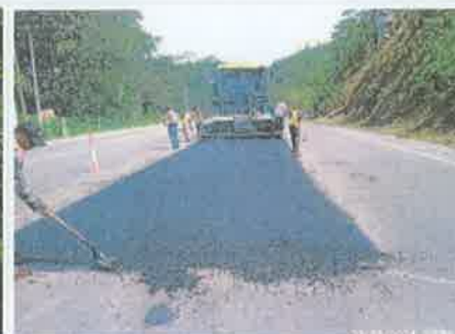
Foto 5. Taulabé – Desvió Santa Cruz de Yojoa Colocación y compactación franja de mezcla asfáltica, espesor 5 cm.