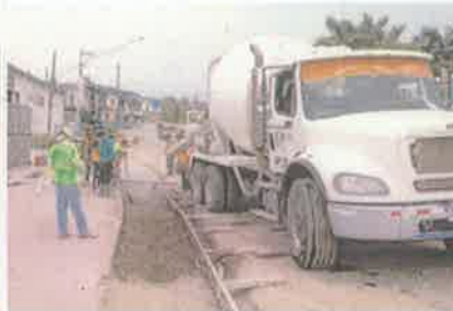
Foto 5. Fundición con concreto hidráulico, sección de acera peatonal, e: 10 cm