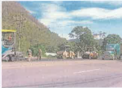
Foto 5. Taulabé – Desvió Santa Cruz de Yojoa Colocación y compactación franja de mezcla asfáltica, e: 5 cm.