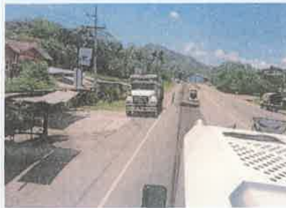
Foto 2. Taulabé – Desvió Santa Cruz de Yojoa Fresado capa superior de carpeta asfáltica dañada, espesor 5 cm