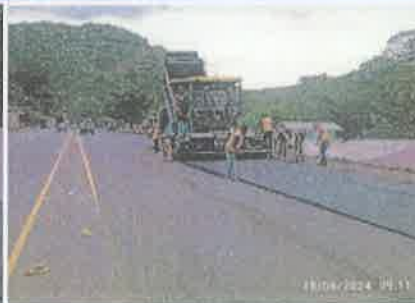
Foto 2. Taulabé – Desvió Santa Cruz de Yojoa Colocación y compactación de la franja de mezcla asfáltica, espesor 5 cm.