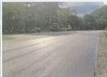
Foto 5. Taulabé – Desvío Santa Cruz de Yojoa Vista de la carpeta asfáltica colocada.