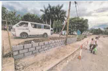
Foto 1. Construcción de pared con bloques de concreto en Terminal de Buses.