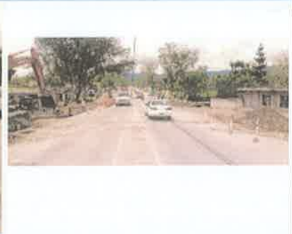
Foto 3. Vista frontal de la construcción del Puente.