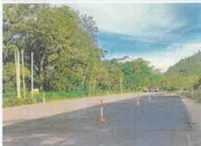
Foto 4. Taulabé – Desvío Santa Cruz de Yojoa Vista del tramo reparado con carpeta asfáltica.