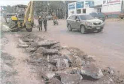
Foto 7. Demolición losas de concreto existentes frente a ferretería FEFASA.