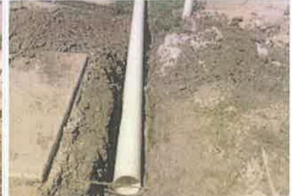
Foto 6. Colocación de tubería de PVC de 6 pulgadas.