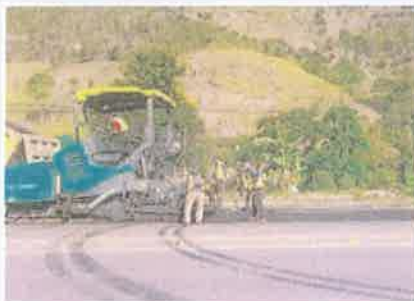
Foto 4. Taulabé – Desvió Santa Cruz de Yojoa Colocación de mezcla asfáltica en franja