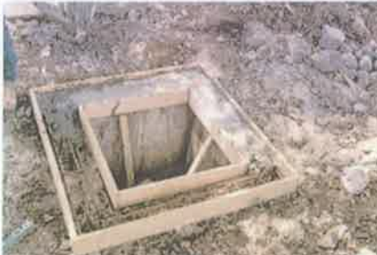
Foto 4. Fundición parte superior de caja de registro.