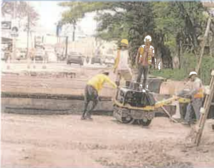
Foto 1. Compactación del material selecto colocado contiguo a pantalla de estribo.