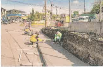
Foto 2. Fundición con concreto hidráulico, sección de acera peatonal, e: 10 cm