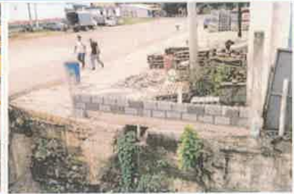
Foto 3. Vista del segmento de pared contiguo a Ferreteria, construida con bloques.