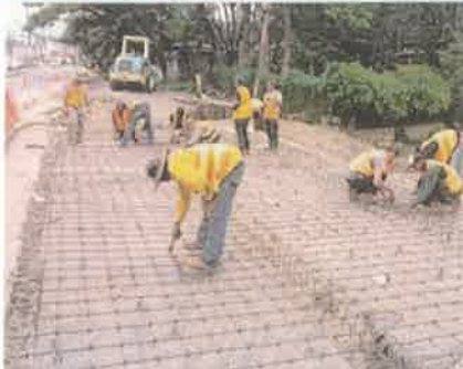
Foto 1. Preparando el área para construcción de Losa de rodadura de Puente