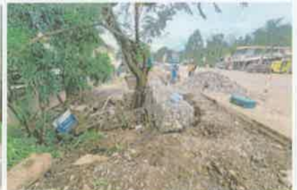
Foto 9. Construcción de Gavión.