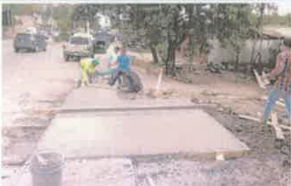
Foto 4. Construcción de acera peatonal y acceso