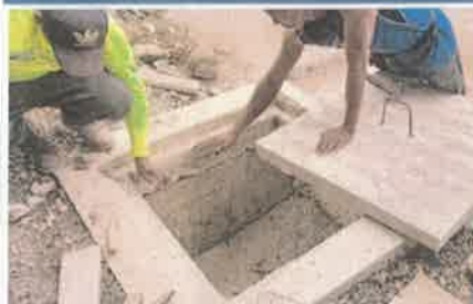
Foto 1. Construcción caja de registro