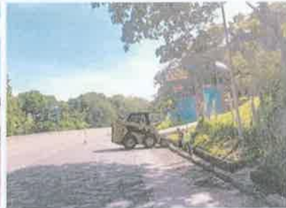
Foto 6. Taulabé – Desvió Santa Cruz de Yojoa Limpieza realizada en cuneta enchapada tipo canal.