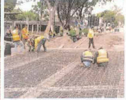
Foto 3. Vista del trabajo ejecutado, lado derecho.