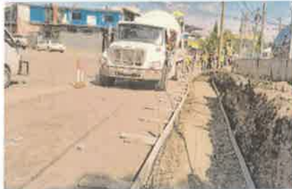
Foto 1. Fundición con concreto hidráulico de acera peatonal.