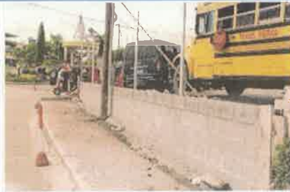
Foto 2. Vista del segmento de pared construida.