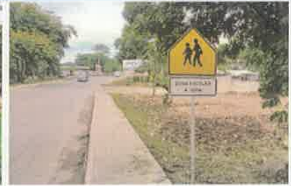
Foto 3. Colocación de la señalización vial informativa