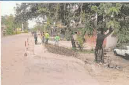
Foto 2. Vista de las áreas en donde se construyó acera peatonal