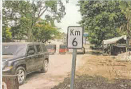
Foto 8. Colocación de señales en varios sitios del proyecto (señal de kilometraje)