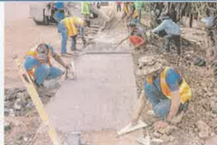
Foto 2. Fundición con concreto hidráulico, sección de acera peatonal, e: 10 cm