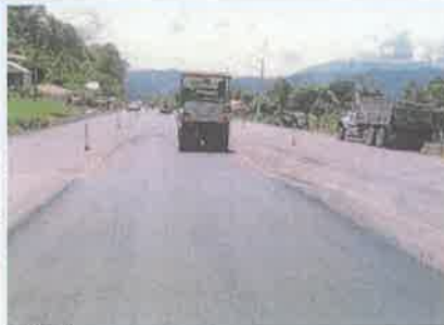
Foto 2. Siguatepeque - Taulabé Compactación de mezcla asfáltica, franja interna. Vista adelante.