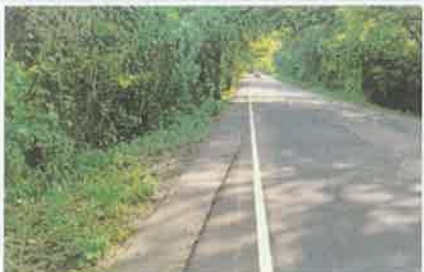
Foto 7. Vista de la pintura blanca colocada en franja lateral de la vía.